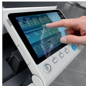
Pannello di controllo multi-touch 9,0" con tastierino 10 tasti (opzionale)

Le nuove Olivetti d-Color MF652plus e d-Color MF752plus, grazie alla loro velocità fino a 75 pagine al minuto, ed alla loro alta risoluzione in stampa di 1200 x 1200 dpi, possono affrontare senza problemi i carichi di lavoro più pesanti degli uffici. La gamma di impiego oggi si allarga anche ai centri di produzione di stampa, oppure agli operatori di arti grafiche, grazie all'opzione Fiery in grado di gestire al meglio i profili colore. Tutto questo nel pieno rispetto del nuovo standard Energy Star 2.0