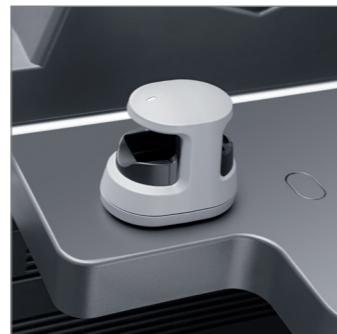
Opzioni di sicurezza evolute, molteplici sistemi di autenticazione